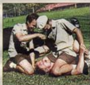
Scen ur ett av Mariken Kramers videoverk.

mänskliga relationer när hon i sina videoverk suddar ut skillnaderna mellan skratt och mobbing, hjälp och övergrepp. Under tiden växer knotiga kvistar ut från den hjortkrona Theo Ågren