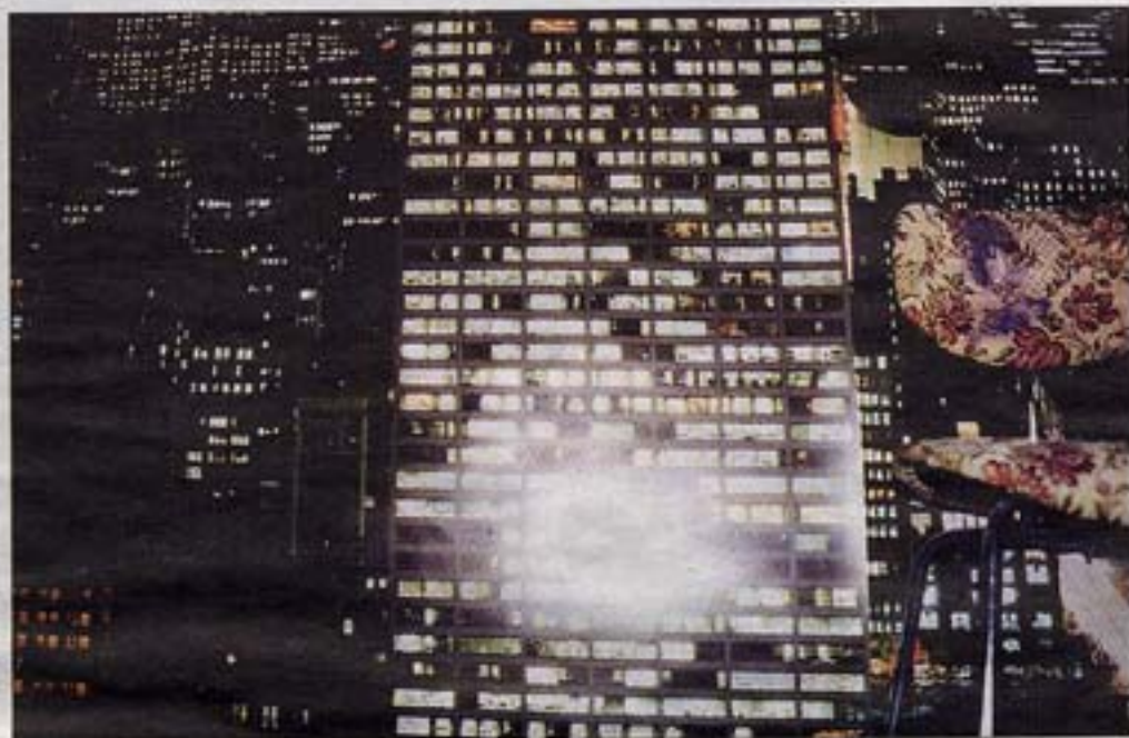
En av Björn Hegardts bilder från Berlin.